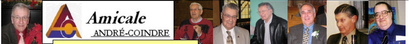
Nos sept présidents du deuxième 15 ans d'histoire

depuis la fondation, le 11 mars 1972 : 2e tranche de 1987 à 2002