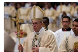
Le pape François bénit les fidèles après la messe de l'Épiphanie

À l'Épiphanie, le pape invite à s'inspirer des mages.