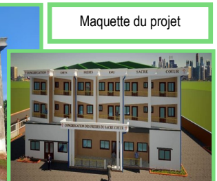
Maquette du projet